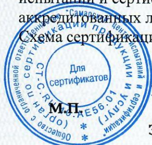
Схема сертификации: 2.

акт оценки оказания услуги (работы) № 00062 от 29.04.2020, протоколы испытаний продукции общественного питания №№ 3250 МБ, 3251 МБ от 29.04.2020 Испытательной лаборатории Общества с ограниченной ответственностью "Самарский центр испытаний и сертификации", уникальный номер записи об аккредитации в реестре аккредитованных лиц RA.RU.21AB46 от 09.02.2016.